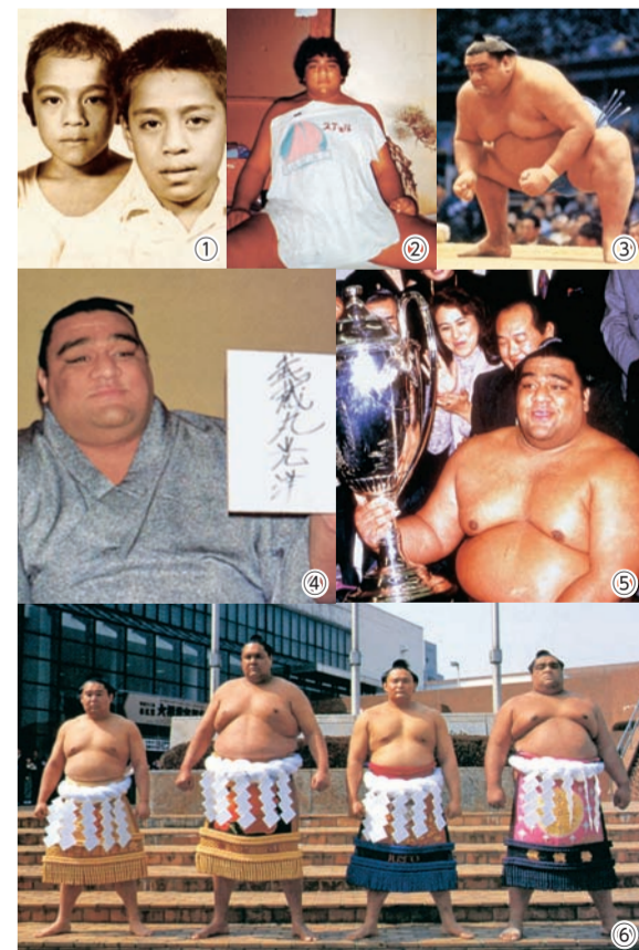
①小学生時代(左)／②入門当時／③④大関時代。初めて体重が200キロを超える。平成8年に日本に帰化し、名を「武蔵丸光洋」に改める／⑤⑥横綱時代。昇進の翌場所に初廻杯を受ける。曙・若貴兄弟との4ショット