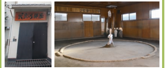
武蔵川部屋公式サイト http://musashigawa.com/