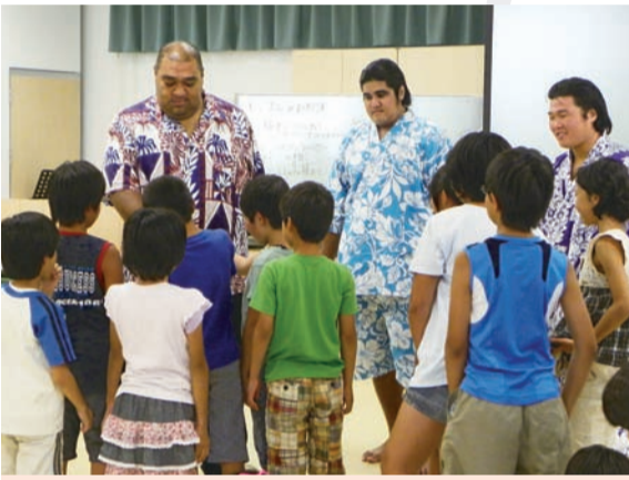
部屋を挙げて区内のイベントにも積極的に参加し、区民との交流を深めている(写真は子ども未来館のイベントでの様子)

区長 ぜひ、その夢に向かって邁進していただきたいと思います。今日は本当にいいお話を聞かせていただき、ありがとうございます。これからはますますご活躍ください。