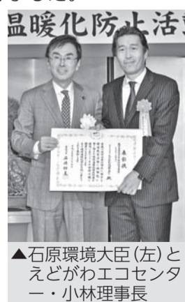
▲石原環境大臣(左)とえどがわエコセンター・小林理事長