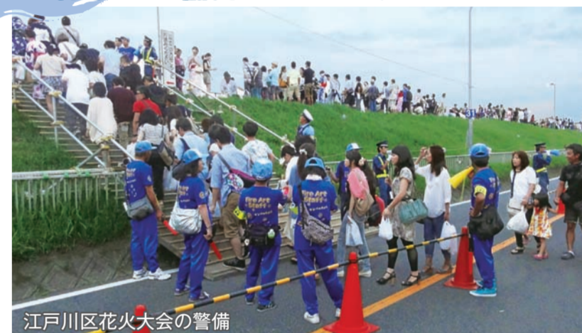
江戸川区花火大会の警備