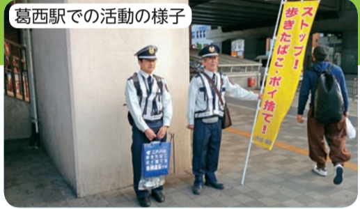
葛西駅での活動の様子

26年2月末日(予定)まで、歩行喫煙等防止員が区内各駅周辺を日~日の10日間、各駅2~3回ずつ巡回活動し、歩行喫煙者などに声掛けを行っています。24年度よりも巡回日数を増やし、条例の周知とマナーの向上を図ります。