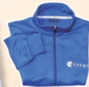
ブルージャージが目印です

時代に即した活動を行うため、定例の講習会や研修、グループ研究などで資質の向上に努め、よりよいアドバイスができるよう心掛けています。例えば、