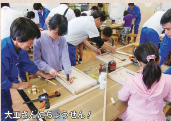
大工さんにちようせん!

子ども未来館の事業をサポートし、子どもたちに研究心を持ってもらうための講座の企画・運営を行っています。