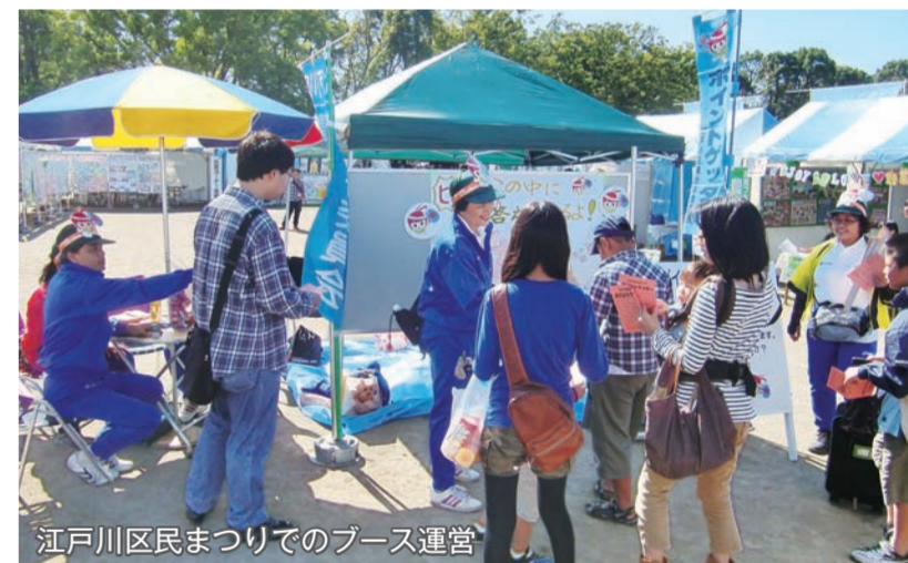
江戸川区民まつりでのブース運営