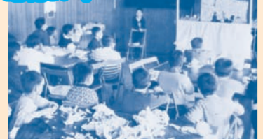
ジュニアリーダー講習会