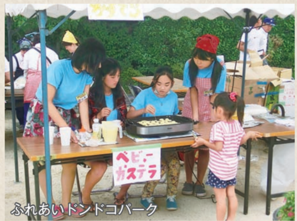
ふれあいドンドコパーク

中学生が積極的に地域活動に参加できる機会と場所を作り、若い力が地域で生きる実績を重ねてもらうことで、次世代の地域のリーダー育成を行っています。