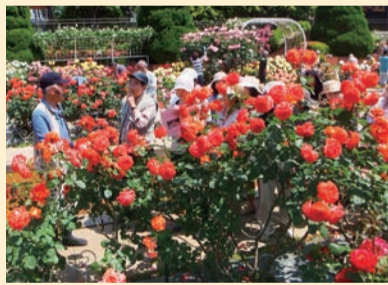
ガイド役を務めるバラ観賞会は、毎年大盛況!

「バラはとってもデリケート。剪定の仕方、水のやり方ひとつで育ち方が変わってしまう。とても神経を使います」と話す出井さん。それほど苦労することをボランティアで行う理由とは?