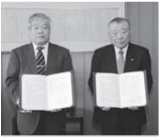
▲協力協定数は53になりました

この締結により、災害時に校舎が避難所や待避所、帰宅困難者の一時受け入れ場所として提供されることとなりました。