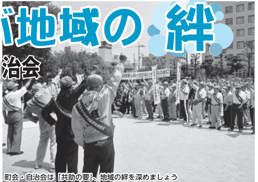
町会・自治会は「共助の要」、地域の絆を深めましょう

日常生活において、地域での活動やつながりは、いざというときに力を発揮します。身近な問題を解決するためにも、町会・自治会に加入しましょう。