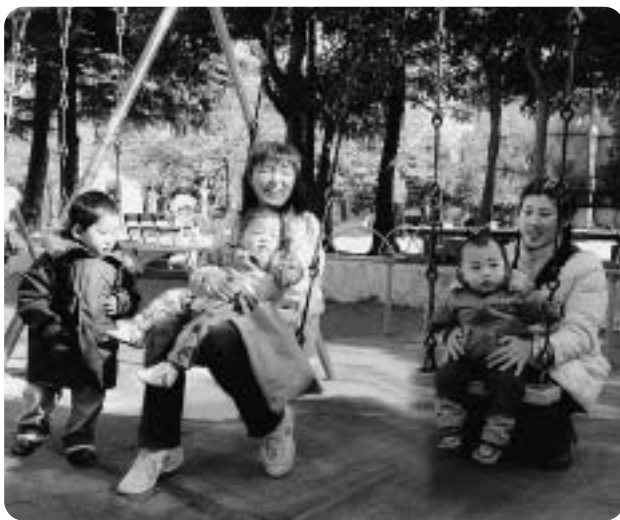
■保育ママ(左)と一緒に公園で楽しく交流！