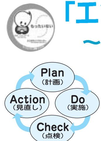
「エコカンパニーえどがわ」は上記のPDCAサイクルに基づいて構成されています

近年、省エネ・省資源・ごみ減量などの環境に配慮した活動は、地球温暖化防止などの環境問題解決の鍵となっています。区では、「もったいない運動えどがわ」の事業者向けとして、多くの事業所が気軽に環境活動に取り組んでいただけるように、区独自の環境マネジメント制度「エコカンパニーえどがわ」をスタートします。 適切な環境活動は、資源の無駄遣いをなくし経費を節約するとともに、事業所のイメージアップにもなります。環境経営へのステップとして、ぜひ「エコカンパニーえどがわ」をご活用ください。