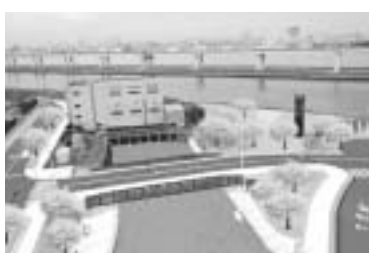
■新川西水門前の黒がね色の格子状の橋です(完成イメージ)

15年度から都が工事を行ってきた新川に架かる都道450号線の橋が、今年度完成します。船堀と北葛西を結ぶ橋の名づけ親になりませんか? ご応募お待ちしております。