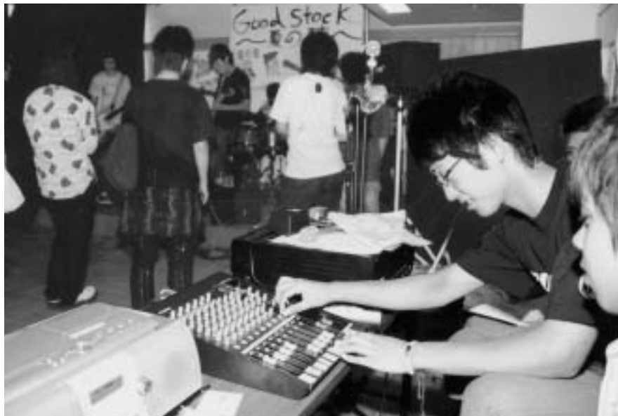
■中学・高校生が企画・参加したリニューアルイベントで、高校生が音楽バンドも演出（共育プラザ平井）