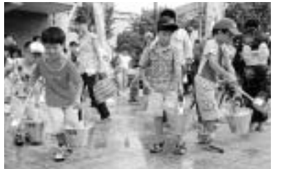
■昨年の道の日キャンペーンで実施された「打ち水」