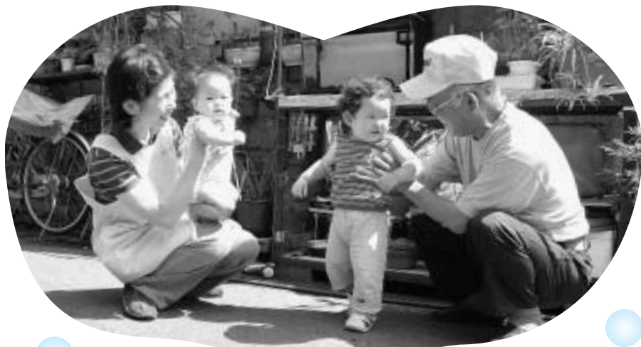
お子さんの成長を 地域で共に喜び合う!

乳児期のお子さんは、家族の豊かな愛情と温もりの中で育まれることが大切です。しかし、ご家庭での保育が困難な保護者もいることから、区では、家庭的な環境の中での温かいふれあいを大切にした、「保育ママ制度」を重点施策として実施しています。そのため、区立保育園では0歳児保育を行っていません。これまでに、保育ママのもとから約1万2,200人ものお子さんが健やかに育ち巣立っています。 問 保育ママ係 ☎(5662)0072