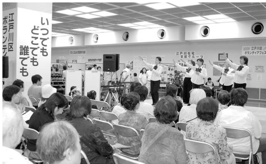
■ステージで日ごろの活動を紹介!