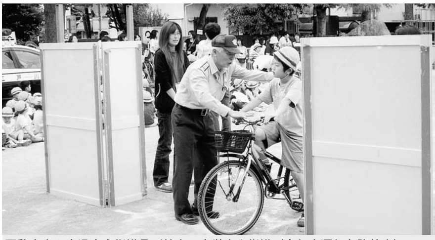
警察官や交通安全指導員が校庭で小学生を指導(自転車運転免許教室)