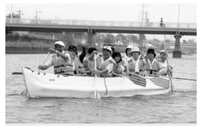
■10人が息を合わせて漕ぐ楽しいEボート