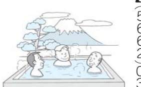
銭湯は、広い湯船にたっぷりリラックスすることで、健康保持・増進の効果が期待できます。

6月1日から都内の公衆浴場の一般入浴料金が400円から430円に改定されました。これに伴い、65歳以上の方が利用されている「健康長寿協力湯」の利用料金を、7月1日(出)から1回210円になります。