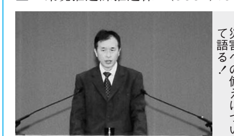
接間神戸新聞社部長、災害への備えについて語る

環境を良くする運動功労者表彰⇄17名・67団体 環境対策優良事業所表彰⇄1団体 優良まちなみ賞表彰⇄1名・2団体 環境推進課推進係 ☎(5662)1991