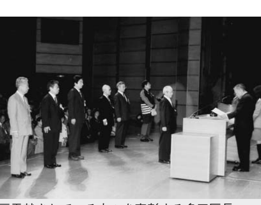
貢献されている方々を表彰する多田区長

区では毎年、「環境をよくする運動中央大会」を開催し、今後の環境への行動指針を発表するとともに、日ごろから地域の住みよい環境づくりに貢献されている方々を表彰しています。