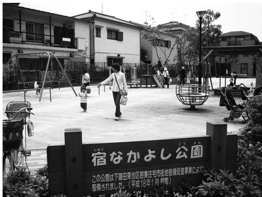
■広いスペースが災害時の一時避難場所などに

下鎌田東地区は、昔の道路形状のままに、住宅が密集している地域です。平成7年の阪神・淡路大震災以降、防災に対する意識が高まり、「災害に強く緑豊かな潤いのあるまち」を目指して、まちづくりに取り組んでいます。災害時にみなさんの防災空間にもなる公園の新設(写真)、そして、避難・救助・消防活動を行う上で重要な道路の拡幅整備を行っています。