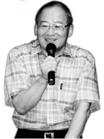
■総合人生大学学長 北野 大