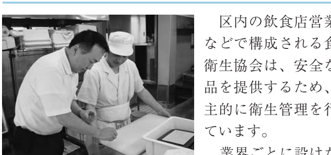
まな板の細菌検査で安全を確認

区内の飲食店業者などで構成される食品衛生協会は、安全な食品を提供するため、自主的に衛生管理を行っています。