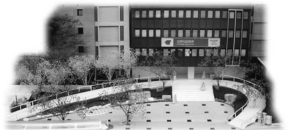
■庁舎前面は広場に！ (完成イメージ)