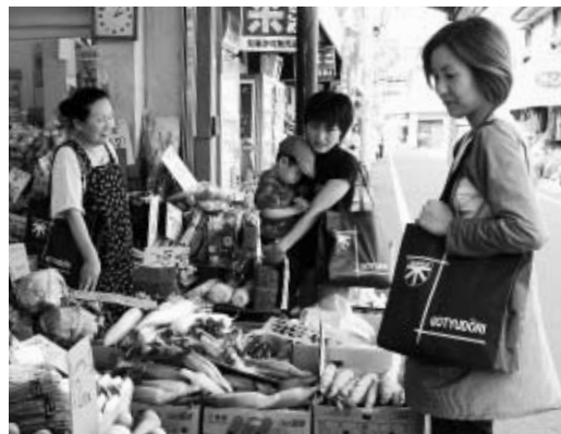
マイバッグを持ってお買い物! (小岩五中通り商店街)

省エネルギー・省資源のために、区とえどがわエコセンターは、区民のみなさんと協働し、「もったいない運動えどがわ」を展開します。身近にある「もったいない」ことを見つめ直し、共に運動に参加しませんか。 ☎ えどがわエコセンター ☎(5662)1651