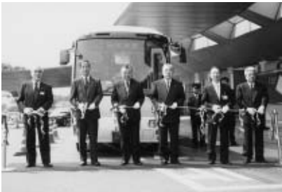
東京臨海病院前で出発式が行われました(6月1日)

6月1日、葛西駅と東京臨海病院を結ぶ直行バスが運行を開始しました。ぜひご利用ください。 運行時刻 下表のとおり