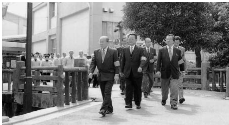
■安全・安心まちづくりパトロール実施中(二之江地区自治連絡協議会)