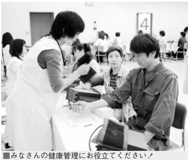
みなさんの健康管理にお役立てください!