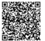
QRコード対応の携帯電話をお持ちの方はこちらから登録できます

登録後、メールが配信されていない方は、アドレスの入力間違いが考えられますので、再度ご登録ください。