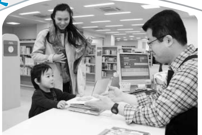
江戸川区の児童書貸し出し数(約148万点)は23区で1番!