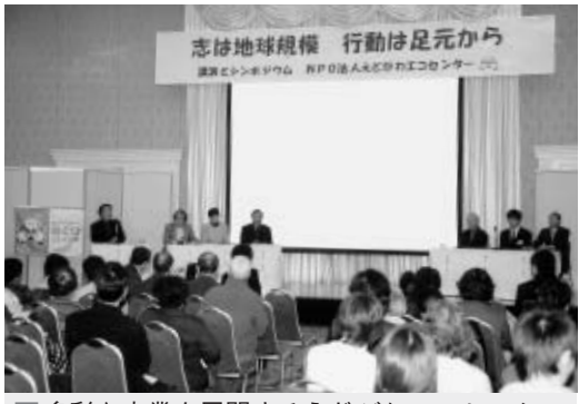
多彩な事業を展開するえどがわエコセンター

「一面向からつづく」 一方、難航していた東京都との都区財政調整交付金に係る主要5課題につきましても、先週、一応の決着を見ることになりました。その内容は、23区にとつて決して満足いくものではないが、今後、協議を継続することを前提に合意したものであります。