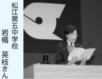
受賞者を代表して、国民体育大会秋季大会陸上競技女子200m走で第1位になったときの体験を発表!