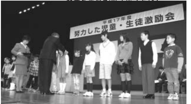
多田区長から一人ひとりにメダルがかけられました

区では、文化・スポーツ活動に意欲的に取り組み、素晴らしい成果を収めた児童・生徒を激励し、栄誉を称えています。今年度は、2月2日、総合文化センターで行われ、