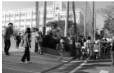
■全校一斉パトロール(17年12月14日、平井西小)

区では「安全・安心マップ」の見直しを行い、警察や地域の方々との連携をさらに深め、各学校では防犯パトロールを実施するなど、子どもの安全を守るための活動をこれまで以上に強化しています。