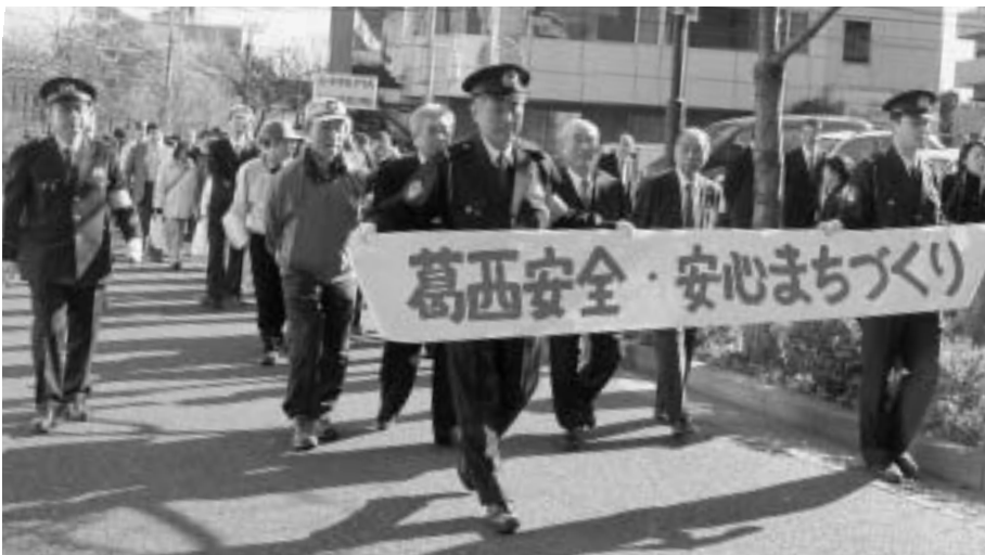
■自分たちのまちは自分たちで守る。(17年12月10日、葛西安全・安心まちづくり総決起集会)

犯罪撲滅に向けた地域のみなさんの地道な安全・安心パトロール活動が実を結び、17年の区内の犯罪件数は、過去最多だった12年と比較すると約5,000件もの減となりました。