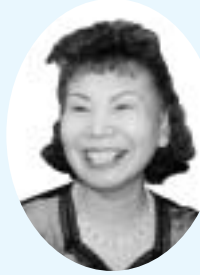
くすのきカルチャー教室 受講生

趣味を持つと元気になり、心も豊かになっていいですね。また、友達も大勢でき、お互い