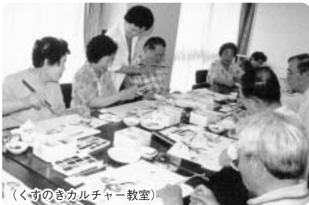
(くすのきカルチャー教室)