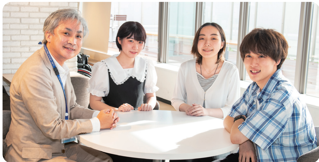
映像制作に取り組む講師と学生の皆さん(撮影時のみマスクを外していただきました)

東京2020パラリンピックの開幕に当たり、全国をリレーし、大会期間を通じて掲げられる聖火。その火が都内の全区市町村ほか各地で採火された種火を集めることで完成するものであることをご存じでしたか？江戸川区で採火式が行われるのは8月20日(予定)。その日のために、共生社会を目指す江戸川区の姿とじっくりと向き合い、採火式の準備に打ち込む若者たちがいます。