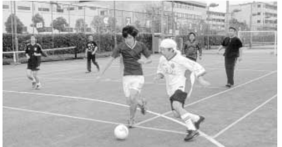
■スポーツ施設の予約が簡単・便利に!