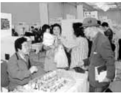
活気あふれる産業ときめきフェア

って活気と広がりを見せる「産業ときめきフェア」と「江戸川「食」文化の祭典」が、今月、開催されたところであります。地域産業の活力を示し、新たな販路の開拓に取り組み意欲に、会場は大変な賑わいでありました。何よりも、明るく元気な業界関係者に、その心意気を感じたのであります。また、野菜と花卉の産出額において、都内随一を誇る本区の都市農業についても、今年度より、朝、採れたての新鮮な農産物の直売会を、毎月定期的に開催しているところでもあります。区民の方々の応援で、生産量を拡大しながら、全国に通じるブランド化を目指しております。