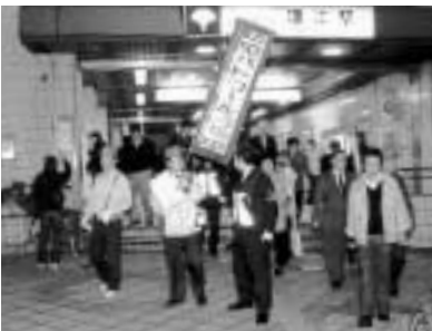
区内各地で活発なパトロール

また、庁用車を使用しての防犯PRのほか、新たに警備会社に委託して、夜間パトロールを実施することとし、犯罪を未然に防ぐ体制を強化してまいります。さらに、区の職員がまちを巡回する際に、違法駐車を取り締まりを行うことができるよう、国に向けて、構造改革特区の提案申請を行ったところでもあります。これが承認されれば、区としての応援体制を築き、警察は犯罪捜査に一層力を注ぐことが可能となります。また、すでに小岩地区で、地域の方々が募金を集めて、防犯カメラ60台を設置し、葛西地区自治会連合会では、警察部会が組織されるなど、まちぐるみで防犯に取り組み力強い活動が、いたるところで展開されております。今後、地域・行政そして関係機関が連携し、全区一丸となって、地域愛を基盤とした、「共育」「協働」の絆を深め、「安全・安心のまち江戸川区」の姿を実現してまいりたいと思っております。