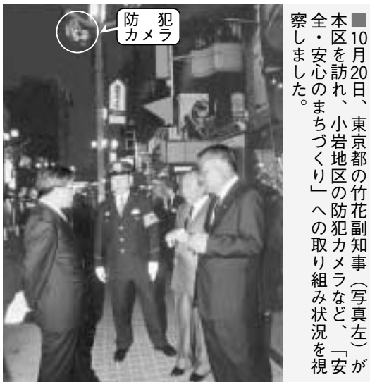
10月20日、東京都の竹花副知事(写真左)が本区を訪れ、小岩地区の防犯カメラなど「安全・安心のまちづくり」への取り組み状況を視察しました。