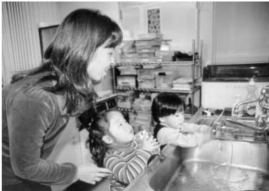
■日ごろから手洗い・うがいを心がけましょう!

発行/江戸川区 編集/広報課 〒132-8501 江戸川区中央1-4-1 ☎(3652)1151(代表) FAX(3652)1109 ホームページ http://www.city.edogawa.tokyo.jp/