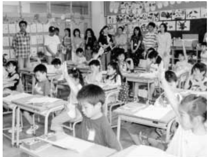
■わかる授業・楽しい授業に取り組んでいます