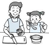
つくってたべよう

①つくってたべよう「おたのしみスパゲティと白玉フルーツポンチ」 11月15日(土)9時45分～12時50分 5歳以上の方50人（先着順）※保護者の方も参加できます。1人200円 11月14日(金)までに直接、一之江第一児童館へ