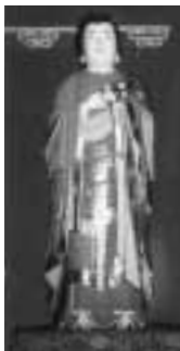
▲木造聖徳太子立像(明福寺)

①秋の歴史探訪・文化財と紅葉めぐり 紅葉のまちをめくりながら、区内の文化財を訪ねます。11月11日(火)9時30分～15時30分（雨天実施）※グリーンパレス集合。 諏訪神社(旧本殿)⇒小松川千本桜(紅葉)⇒宇田川家長屋門⇒古川親水公園⇒ホテルシーサイド江戸川(昼食) ▲木造聖徳太子立像(明福寺) ⇒明福寺(木造彫刻)⇒御番所町跡(常燈明ほか) 30人(抽選) 昼食代1430円