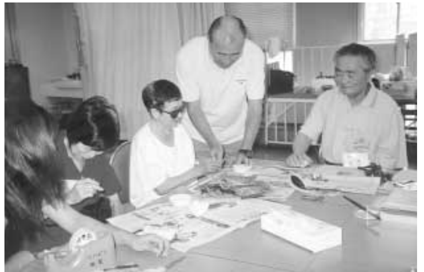
■自立支援セミナーで作業をしながら楽しくリハビリを