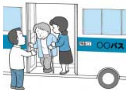
■バスの乗り降りも体験！

◎途中からの参加や見学も可能です。詳しくは各健康サポートセンターまでお問い合わせください。