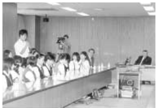
いきいきと現地での体験を報告する団員

さて、こうした土壌に育つ青少年の意欲をさらに高め、大きく成長してもらいたいという願いから、この夏に、第1回中学・高校生の海外派遣事業「青少年の翼」を実施したところでありましたが、関係者の協力を得て、期待以上の成果をもたらすことができました。 カナダ、ニュージーランド、それぞれ30名の団員が、12日間を通じて現地の人々と生活を共にし、各国の文化と歴史・民族性に触れ、あらためて日本という国と、自ら暮らす地域について、思い巡らす機会を得たのであります。 先の帰国報告会では、短期間にもかかわらず、驚くほど成長