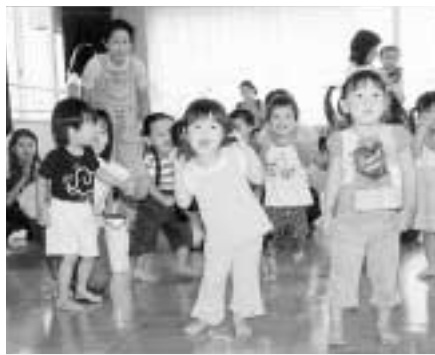
のびのびと心豊かに育つ子どもたち

平成15年第3回区議会定例会の開会にあたり、ごあいさつを申し上げます。 本区の人口は、去る7月に、65万人の万台を突破いたしました。昨年1月より、一年半ほどで、約1万人が増加したことになり、全国3000余の自治体でも、20番目の大都市として、今なお、成長を続けております。 この人口増加は、主に20代・30代の世代の転入と、毎年7000人からの出生によるものでありますが、このことは、地域に若い活力をもたらし、区内に長く暮らす方々とよく溶け込んで、本区の新しい個性を生み出しているのではありません。 このように、人口増加を、よりパワフルな地域のエネルギーに転換していく力強さこそ、本区の逞しい成長力であり、また、若い世代が地域に定着し、