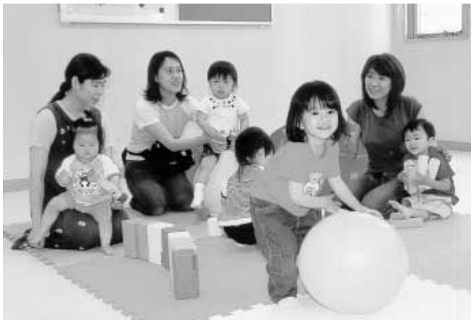
■親子の輝く笑顔がいっぱい! (東部健康サポートセンター・子育てひろば)

区では、未来を担う子どもたちの健やかな成長を願い、安心して子育てができるように様々な支援を行っています。