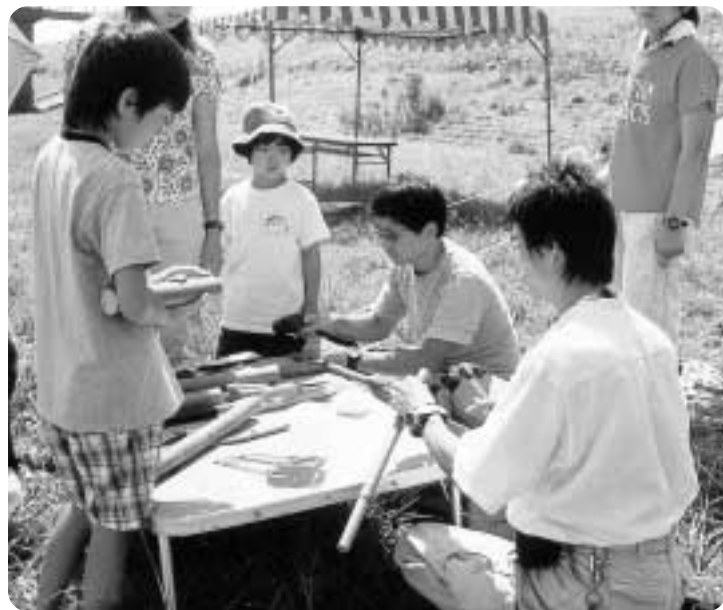
■ボランティアの方と竹筒で水鉄砲を作成中！(江戸川河川敷)