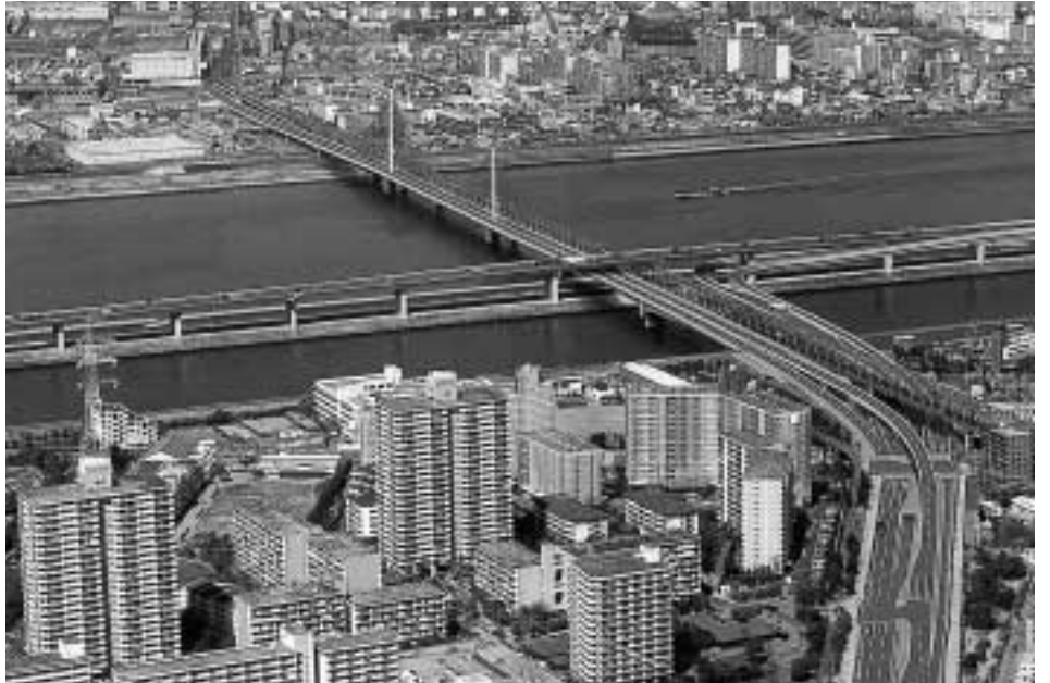
■荒川横断橋梁完成後のまちなみ(清新町付近)

平成8年から工事が始まった放射16号線の荒川横断橋梁(仮称)が、いよいよ来年の春に完成します。都内の川に架かる最も長い船堀橋(桁橋)に次ぐ規模の橋です。都心への乗り入れがより便利になるとともに、周辺地域の交通渋滞の解消につながる荒川横断橋梁の名称を募集しています。あなたが名づけ親になりませんか。 問 土木部計画課 ☎(5662)1885