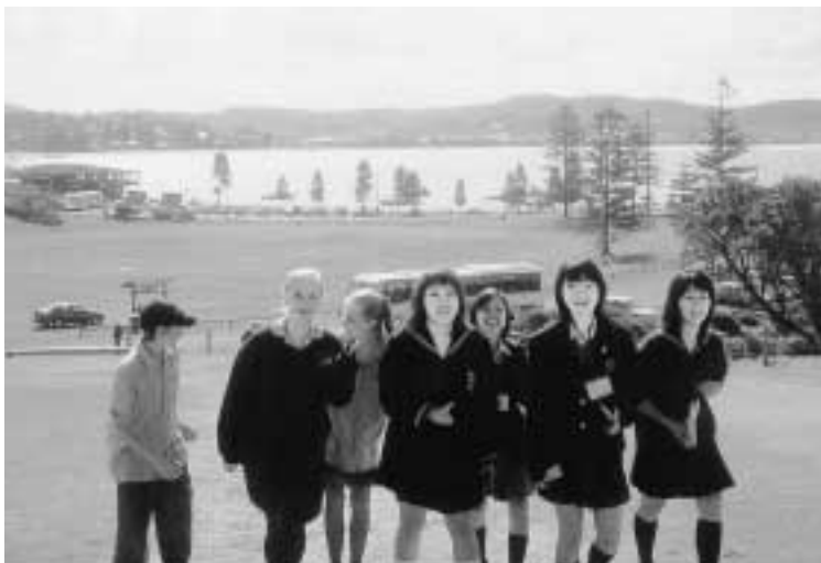
■海外の豊かな大自然を満喫!(昨年のごスフォード市高校生訪問団)