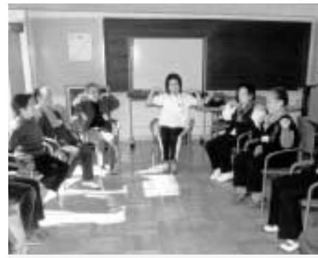
▲みんなで手軽に楽しく体操!

家庭にひきこもりがちな60歳以上の方を対象に、書道・手芸・体操などの趣味・生きがい活動を通して仲間づくりや介護予防のお手伝いをしています。瑞江・清新に続き、4月に小岩熟年ふれあいセンターがオープンし、3つになりました。