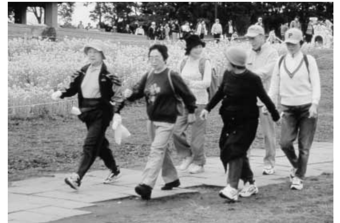
■葛西臨海公園の菜の花を楽しみながら健康づくり(健康ウォーキング大会)