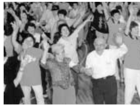
▲いきいきはつらつ! リズム運動

健康づくり・仲間づくりを目的として、60歳以上の方を対象に行っています。社交ダンスなどを取り入れた軽運動で、くすのきクラブを中心にしています。