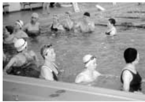
▲無理せずできる水中ウォーキング教室