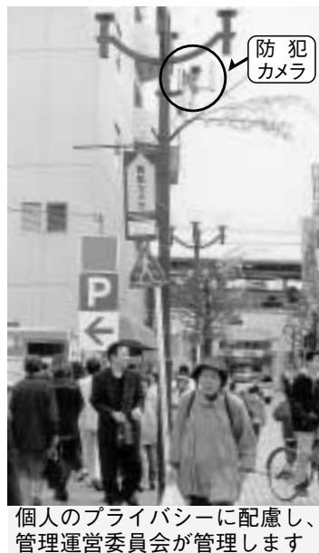
個人のプライバシーに配慮し、管理運営委員会が管理します

16年度採用 江戸川区職員〔I類〕採用説明会 「江戸川区職員として公務を全うしたい」という人材を募集しています。参加を希望する方は、直接会場へお越しください。 日時 4月25日(金)13時30分～15時30分 会場 タワーホール船堀(総務課) ☎(5662) 1002