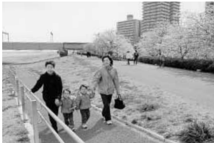
■負担の少ない河川堤防のスロープ（小松川千本桜付近）

熟年者や車いす・ベビーカーを利用する方が、安心して水辺を憩いの場として利用できるように、河川堤防へのスロープ・堤防階段への手すりの設置などを行っています。