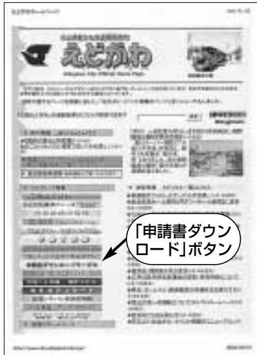
①区公式ホームページのトップページにある「申請書ダウンロード」ボタンをクリックします