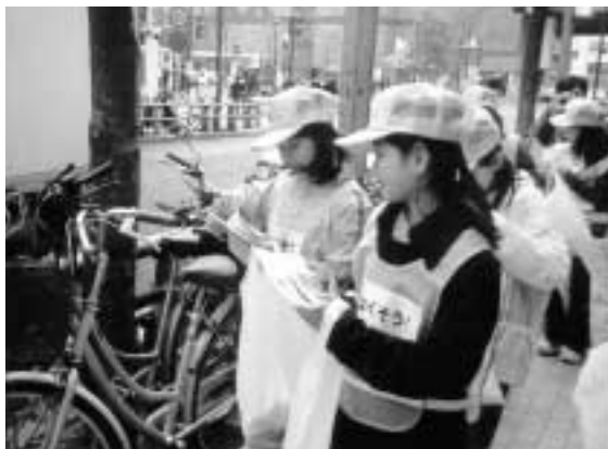
■放置自転車防止の啓発活動を行う 西葛西小のみなさん