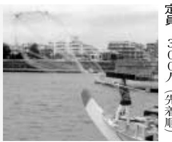
今に受け継がれる伝統の技

粋なお江戸の船遊び お江戸投網まつり 今ではもう見られなくなった「投網漁業」。伝統文化を屋形船に揺られながら楽しんでみませんか。 日時 5月5日(祝)10時30分集合・11時出船 コース 今井水上ステーション(集合・解散) 葛西臨海公園沖 定員 300人(先着順) 費用 5000円 ※小学生以下半額。料理と一人1本の飲み物付き。 主催 江戸投網保存会 代表者氏名・電話・参加人数を記入しフアクシミリで、あみ豊FAX(3679)0636/岡田屋FAX(3689)2892 乗り合い屋形船 5月は遊船紹介月間です。多くの方に屋形船の魅力を感じてほしい。 費用 8000円 ※小学生以下半額。消費税別。料理・飲み物付き。 主催 江戸川遊漁船組合 電話で左表の各船宿へ《後援》 江戸川区農産係 ☎(5662) 0539 ▼乗り合い屋形船実施船宿一覧 船宿名 住所 電話 たかは丸 松本2-40-3 (3674)2780 豆や 鹿骨6-1-1 (3679)2065 あみ達 西瑞江4-1-20 (3655)2780 あみ豊 江戸川3-44-6 (3679)0610 網さだ 江戸川4-4 (3679)3859 あみ貞 江戸川4-4 (3679)3576 あみ徳 江戸川4-16-1 (3651)9533 あみ弁 江戸川4-20-8 (3651)4607 あみ元 江戸川5-2 (3680)3955 岡田屋 江戸川5-29 (3689)2892 あみ幸 江戸川5-31-6 (3680)5755 あみ武 東葛西3-15-8 (3686)4675 須原屋 東葛西4-58-27 (3689)2780