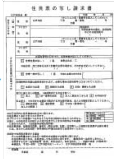
③申請書が表示されます(必要事項を記入することもできます)