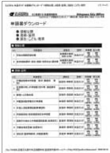
②申請書一覧表から必要な申請書を選択します