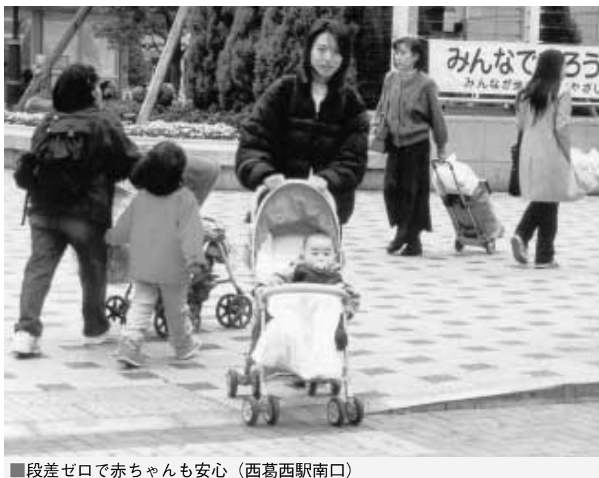
■段差ゼロで赤ちゃんも安心 (西葛西駅南口)