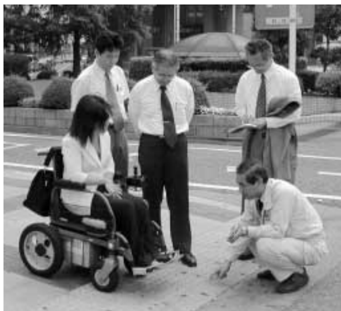
■さまざまな視点から意見を聴くフィールドワーク