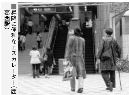
葛西駅 昇降に便利なエスカレーター（西）

区内各駅のバリアフリー化については、区が鉄道事業者と連携し、整備費用の一部を負担しながら周辺の道路・駅前広場などと一体的に推進しています。