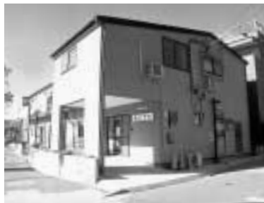
■区内5か所目のグループホーム「あじさい」