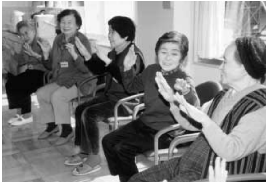
■手軽にからだを動かして楽しく元気に（瑞江ふれあいセンター）