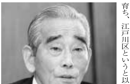
しっかりとした 目標を持って歩いて ほしい (石川)

石川 江戸川区で生まれ、ずっと暮らしてきました。以前は、雨が降ると長靴がなければ歩けないまちでしたが、下水道整備や区画整理事業などによって、緑豊かなきれいなまちになりました。これは町会・自治会や熟年者など地域の皆さんが、区と力を合わせがんばってきた成果です。