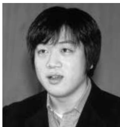
自分というものをもち 胸を張って生きて いきたい (針谷)

矢口 区内のイタリア料理店に勤めています。初めは洋菓子の職人を希望していましたが、ケーキだけでなく料理もということになり、料理の基本から教わっています。新しいことを勉強するのは楽しくて、まず今の仕事を覚え、学べることはすべて学んでおきたいと思っています。