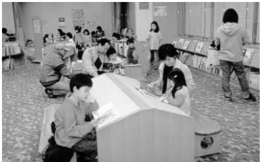
■児童図書・絵本・紙芝居も充実しています(1階こども図書館)

15年度からコミュニティ会館と併設する本格的な図書館(東葛西8丁目)の建設に取り組みます。