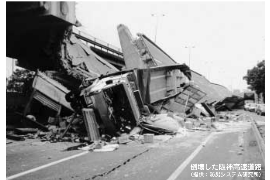
■阪神・淡路大震災(平成7年1月17日・死傷者41,179人)