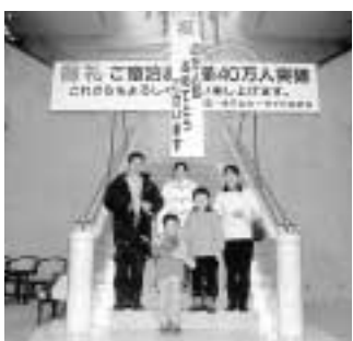
■宿泊40万人目の在家さん一家

会場 中央図書館視聴覚ホール 定員 各60人 申問 1月22日(水)10時から電話で先着順、 松江図書館☎(3654) 7251