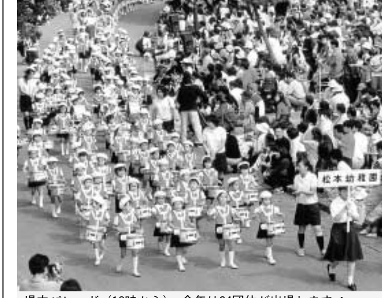
場内パレード(12時から)。今年は34団体が出場します!