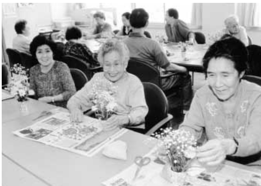
■福祉サービスを利用して楽しく生きがい・仲間づくり(熟年ふれあいセンター)