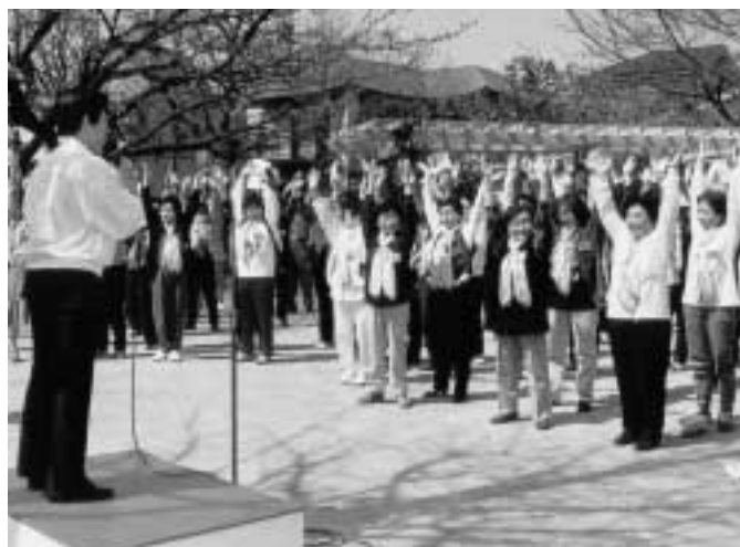
■適度な運動で生活習慣の改善を