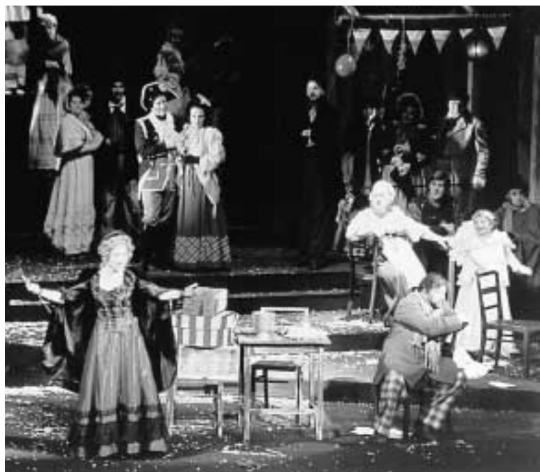
ソフィア国立歌劇場

1890年創立の歴史ある歌劇場。2000年の初来日では新国立劇場をはじめ全国で公演を行い、売り切れ続出の大好評。今公演では、美しいアリアが盛りだくさんのプッチーニの名作「ラ・ボエーム」をお楽しみください。