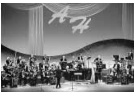
アルフレッド・ハウゼ・タンゴオーケストラ コンチネンタル・タンゴの甘い調べを。

※詳しい公演情報は、随時、広報えどがわ・ポスターなどでご案内します。 ※公演により、チケット購入枚数を制限させていただきます。