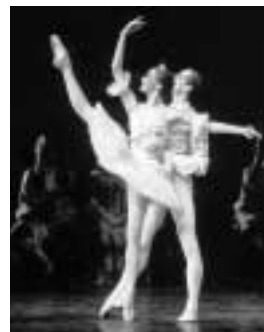
レニングラード国立バレエ 世界が絶賛する優美なアンサンブル!!