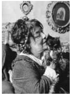
▲フジ子・ヘミング