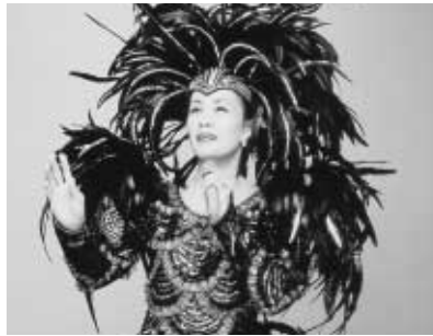
▲浅茅陽子(美空ひばり物語)