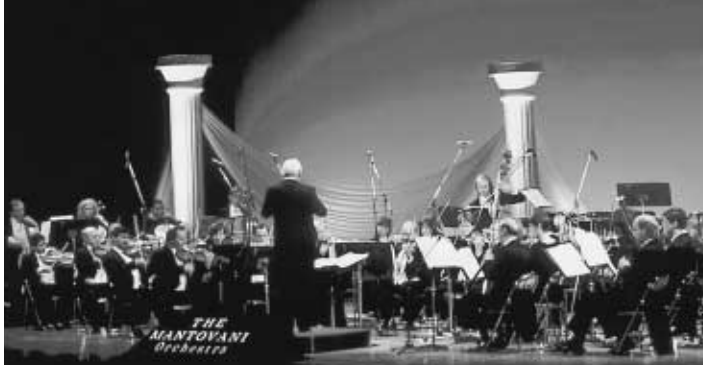
▲マントヴァーニ・オーケストラ