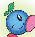
ごみ減量・リサイクル推進キャラクター「くるん」