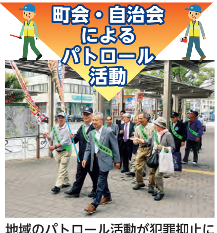
地域のパトロール活動が犯罪抑止に