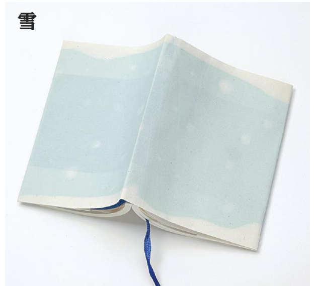
ブックカバー 1,080 円 (税込) デザイン：女子美術大学 小林 十和子