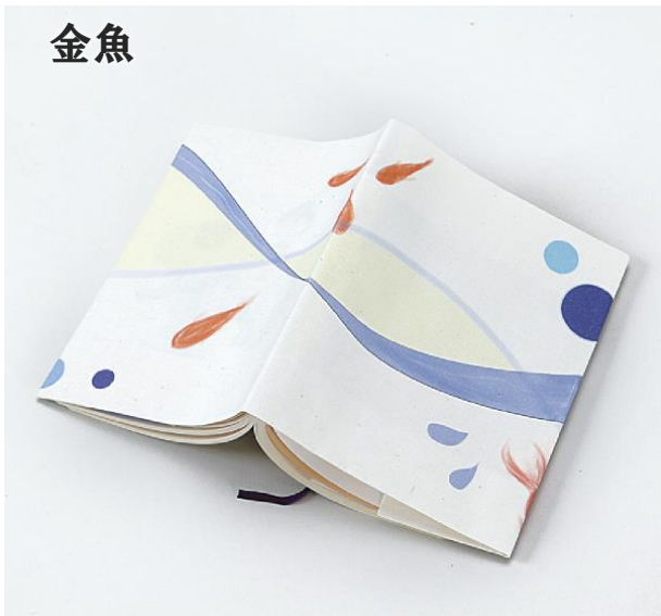
ブックカバー 1,080 円 (税込) デザイン：女子美術大学 小林 十和子