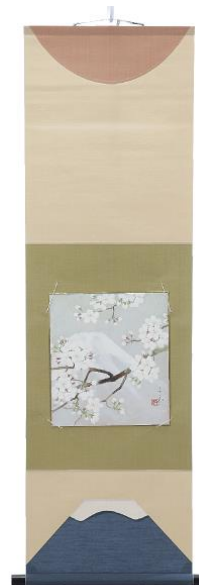
色紙掛 54,000 円 (税込) デザイン：女子美術大学 中村 汐里