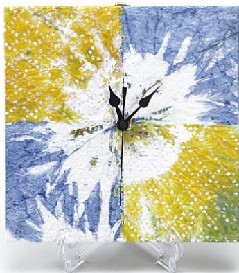
時計 5,940 円 (税込) デザイン：女子美術大学 小林 十和子