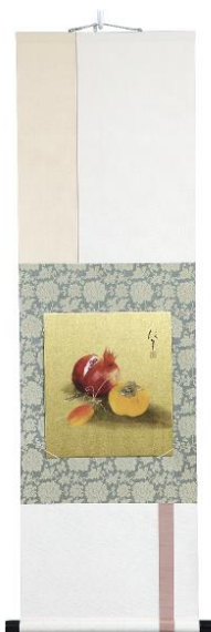
色紙掛 54,000 円 (税込) デザイン：女子美術大学 小林 十和子