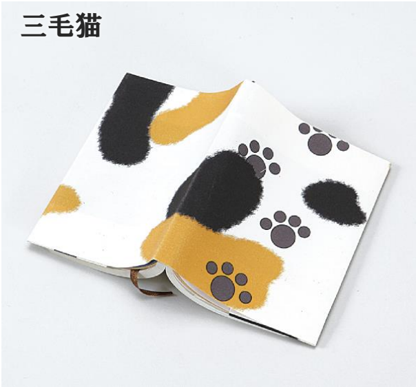
ブックカバー 1,080 円 (税込) デザイン：女子美術大学 小林 十和子