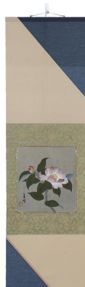
色紙掛 54,000 円 (税込) デザイン：女子美術大学 小林 十和子