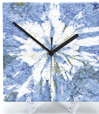
時計 5,940 円 (税込) デザイン：女子美術大学 小林 十和子