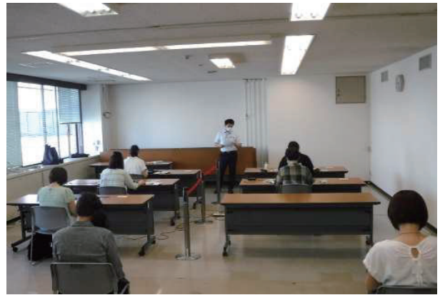
期日前投票受付係講習会