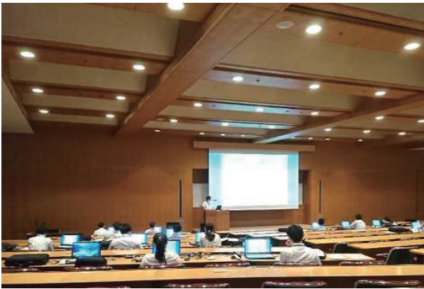
当日投票システム説明会