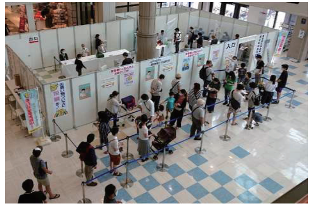
期日前投票 (アリオ葛西)