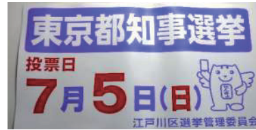
マグネットシート