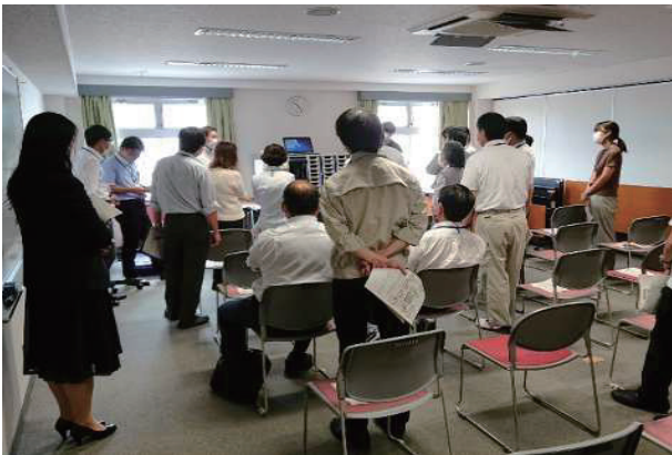
開票事務・分類機係説明会