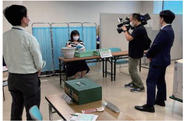
投票所における新型コロナウイルス感染症対策についてのテレビ取材 (Live News days フジテレビ 6月18日放送)