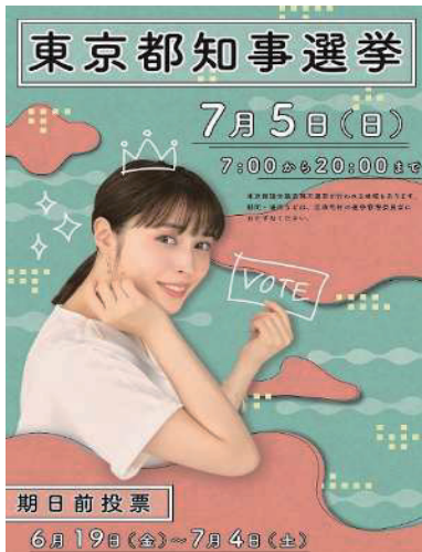
選挙啓発ポスター