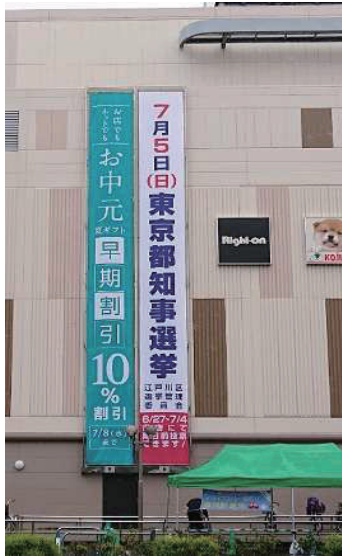
懸垂幕 (アリオ葛西)