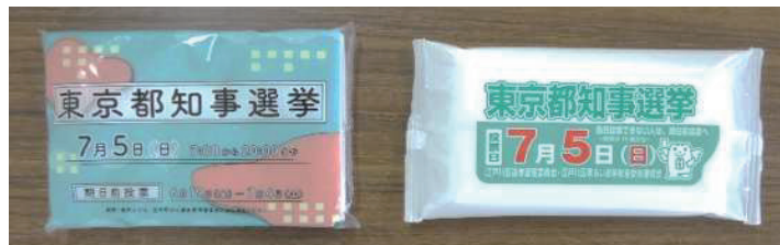
啓発物品(ポケットティッシュ、ウエットティッシュ)