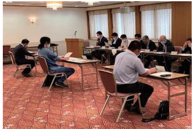
開票立会人説明会