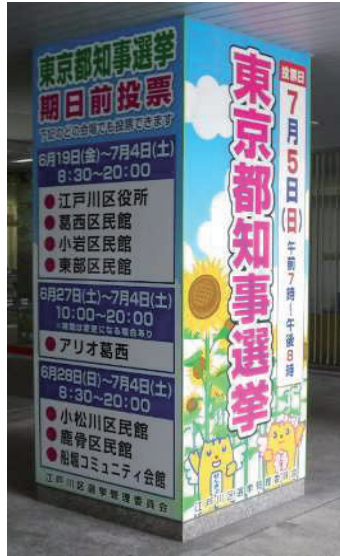
柱巻きサイン (江戸川区役所)