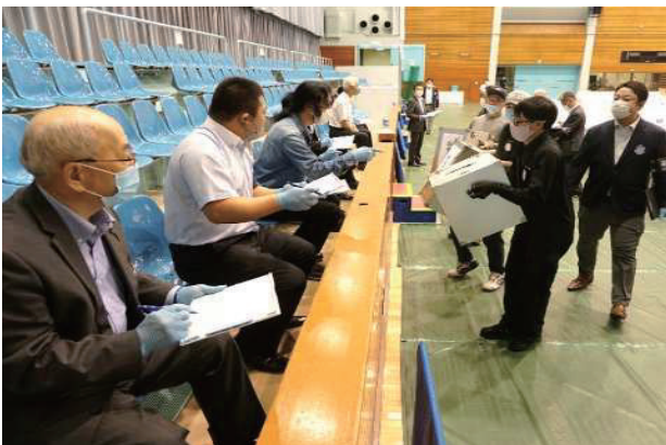
開票所への投票箱搬入