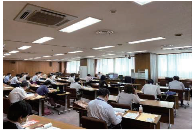
期日前投票班長講習会