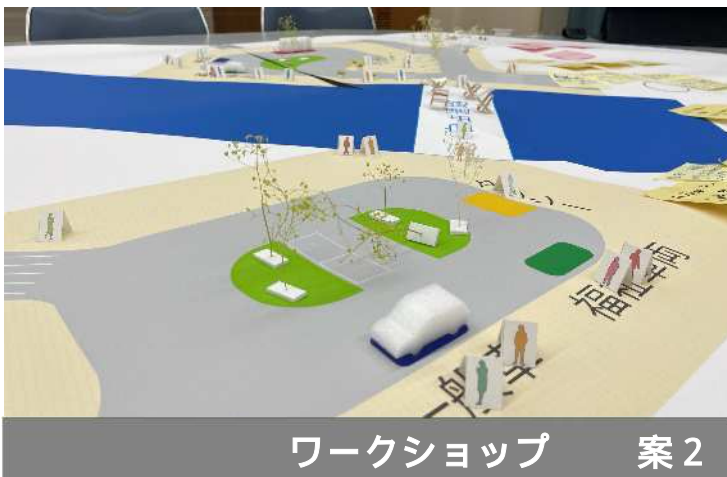
ワークショップ 案2

駅前広場のワークショップは、令和6年度も継続する予定であり、皆さまのご意見により、内容は検討します。