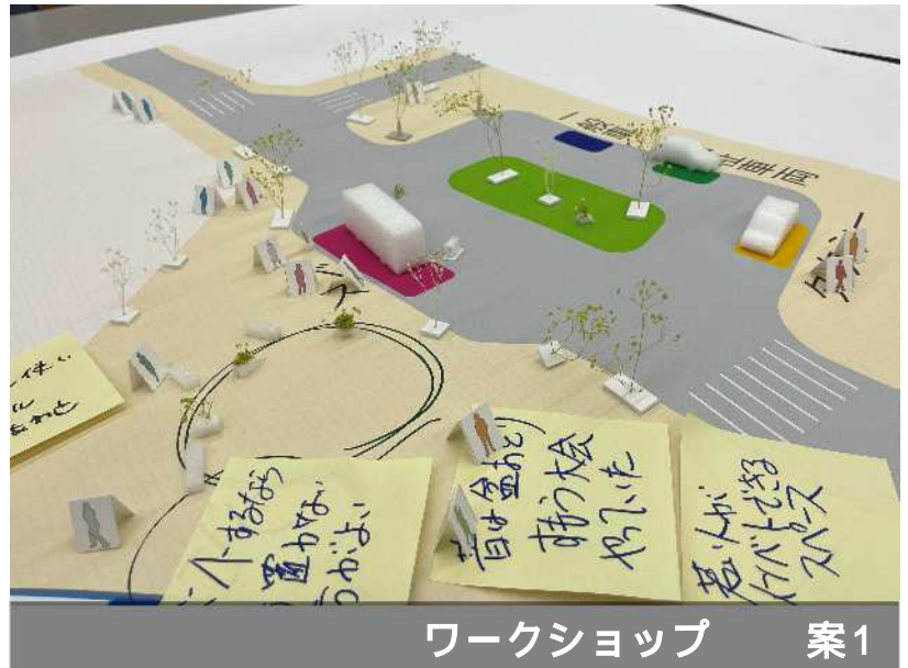
ワークショップ 案1

第10回駅付近区域まちづくり勉強会では、駅前広場についてのワークショップを令和6年2月8日に開催しました。12月に開催したワークショップでのご意見から作成した2つの広場案をもとに、【駅前広場の活用を考える】をテーマに、バスや樹木などの模型を使いながら、意見交換を行いました。