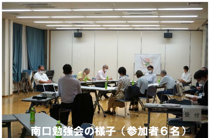
南口勉強会の様子（参加者6名）

また、これまでの勉強会や個別意見交換会では、「もう少し具体的な内容を示してほしい」などの意見がありましたので、より具体的にご意見をいただくための提案をさせていただき、話し合いを行いました。