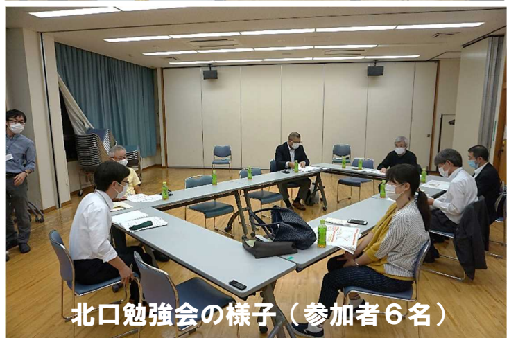
北口勉強会の様子（参加者6名）