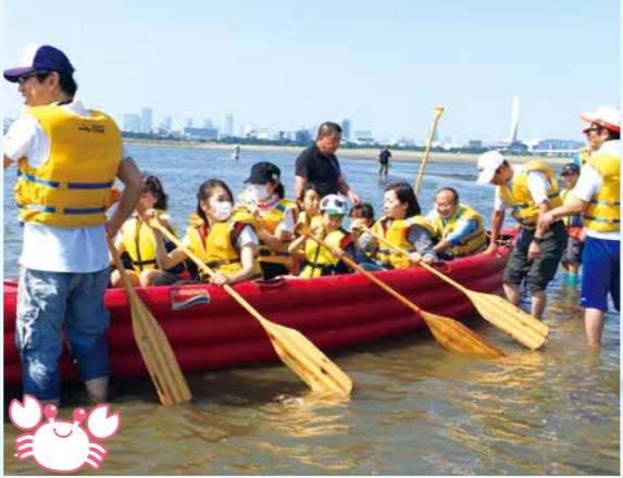
10月・葛西海浜公園

Eボート体験と生物調査は、葛西海浜公園の西なぎさで実施している小学生対象のイベントです。会場となる葛西海浜公園の三枚洲干潟は、平成30(2018)年、東京都では初めて、国際的に重要な湿地の保全を目的とするラムサール条約に登録されました。 Eボート体験は、10人乗りの防災救命用ボートをみんなで膨らませ、海浜公園の西なぎさから遠浅の干潟へオールを手に漕ぎ出す体験型のイベントです。 生物調査は、干潟の生き物を捕まえて観察する身近な自然を満喫できるイベントです。