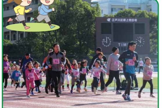
1月・江戸川区陸上競技場