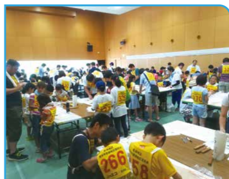
7月・新田コミュニティ会館