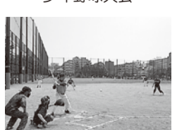
男女混合ソフトボール大会