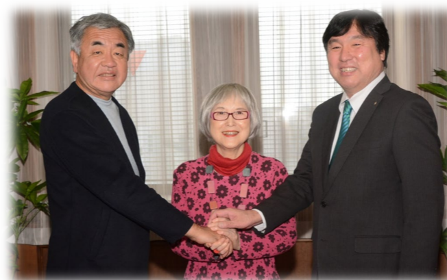
「設計パートナー」決定 令和2（2020）年1月