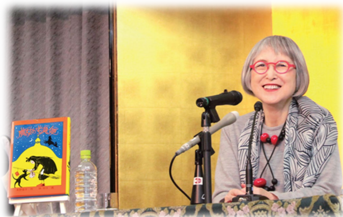
「国際アンデルセン賞 作家賞」受賞 平成30（2018）年8月