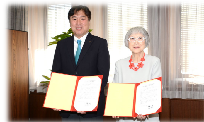
「相互協力・連携確認書」取り交わし 令和元（2019）年5月