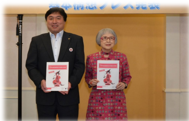
「基本構想」公表 令和元（2019）年9月