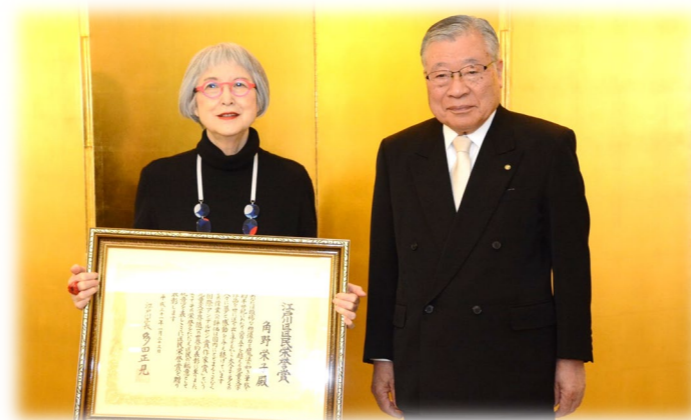
「江戸川区 区民栄誉賞」受賞 平成31（2019）年 1月