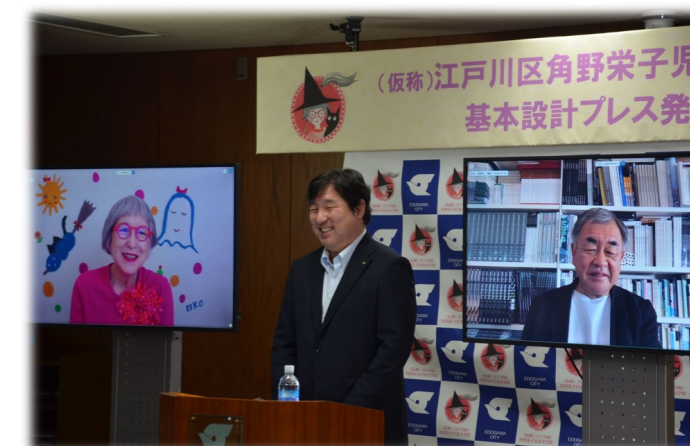
「基本設計」公表 令和2（2020）年10月