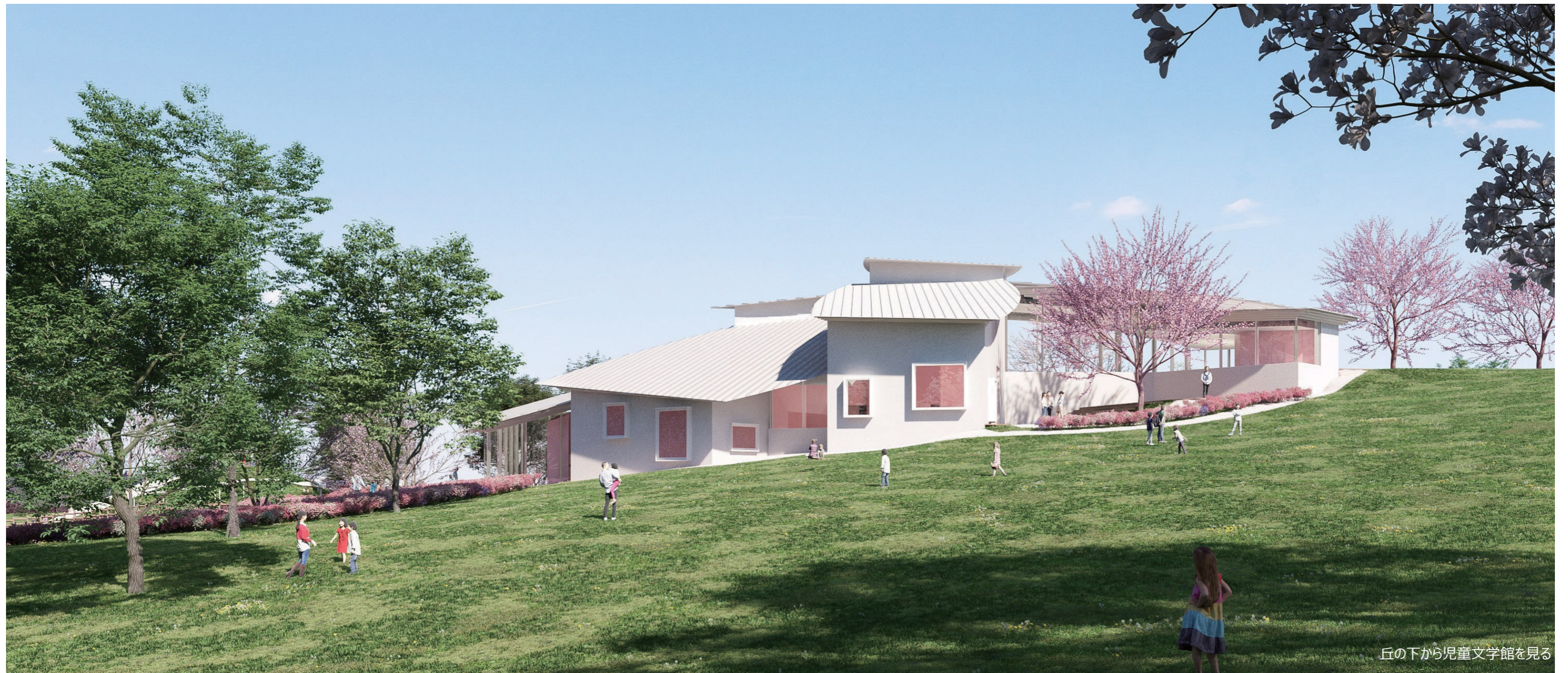
丘の下から児童文学館を見る