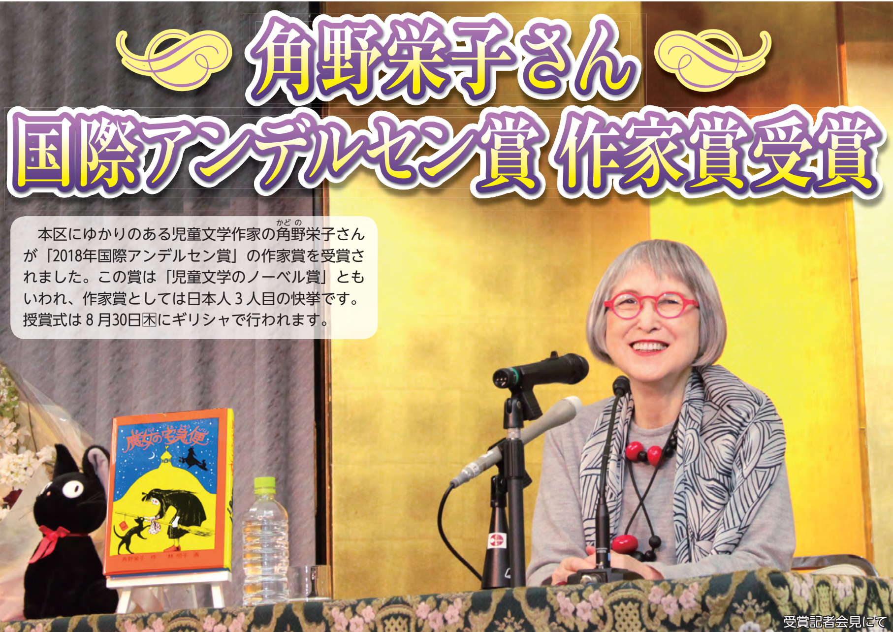
受賞記者会見にて

発行/江戸川区 編集/広報課 〒132-8501 江戸川区中央1-4-1 ☎3652-1151(代表) ☎3652-1109 https://www.city.edogawa.tokyo.jp/