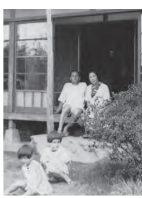
幼少期に住んでいた小岩の自宅(本人は左から2番目)。「幼い頃に見たり感じたりした小岩の光景が、時に作品に表現されている気がします」