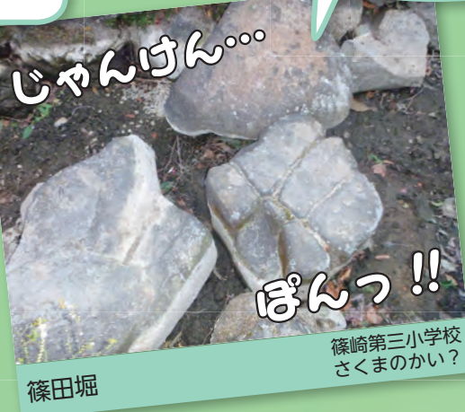
じゃんけん... ぽんっ!! 篠田堀 篠崎第三小学校 さくまのかい？