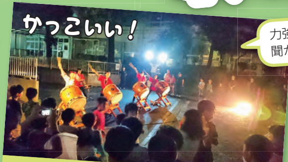
平井西太鼓の音 平井西小学校 3年のひくま？