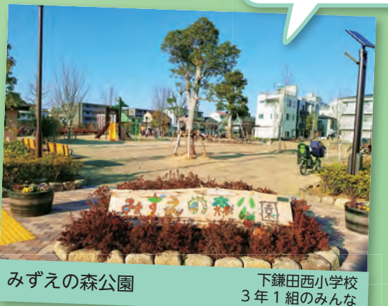
みずえの森公園 下鎌田西小学校 3年1組のみんな

28年にできたばかりの新しい公園です。園名板のデザインは学校のみんなでアイデアを出し合いました！