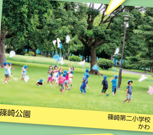
篠崎公園 篠崎第二小学校 かわ

獅子もみは、オスとメスがあります。町内を回って幸せが来よう！にそれぞれの獅子をもみます