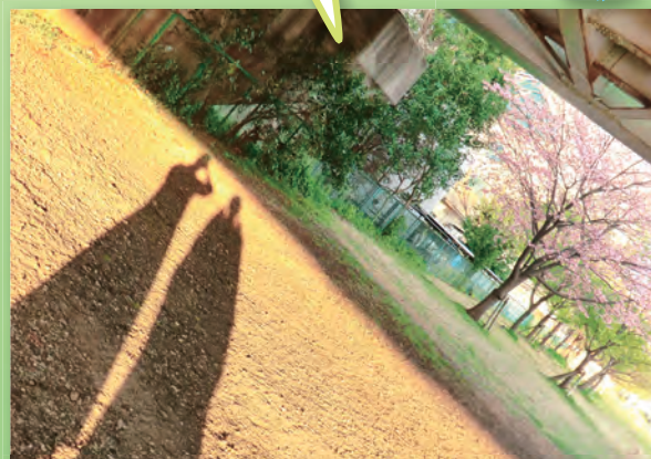
旧中川の桜と私たち 小松川第二中学校 放送部