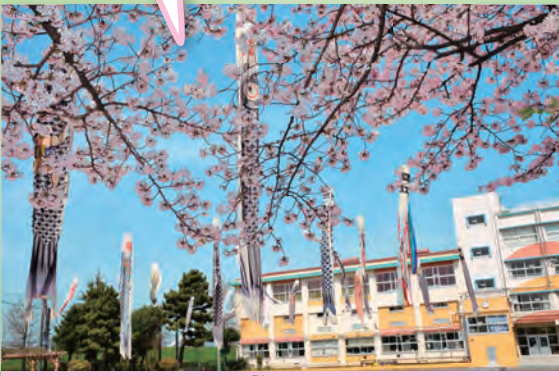
下小岩第二小学校 下小岩第二小学校 鯉のぼり 鉄の人