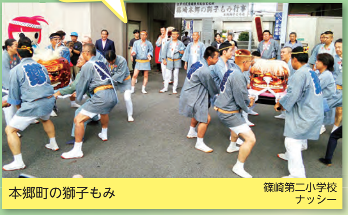
本郷町の獅子もみ 篠崎第二小学校 ナッシー

獅子もみは、オスとメスがあります。町内を回って幸せが来よう！にそれぞれの獅子をもみます