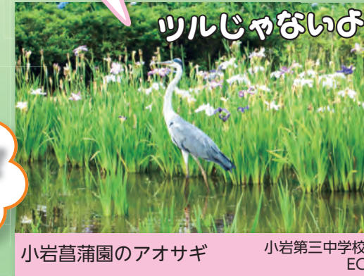
ワルじやないぶ 小岩菖蒲園のアオサギ 小岩第三中学校 EC