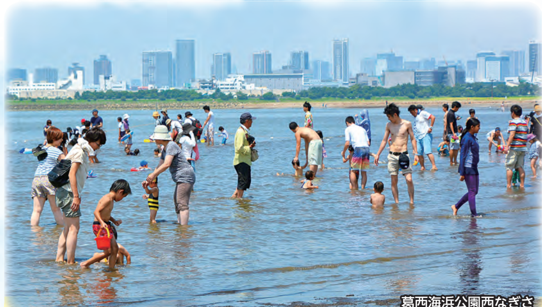
葛西臨海公園西なぎさ

海に面した広大な園内には、水族園や日本最大級の観覧車、磯遊びができる人工なぎさなどがあり、いろいろな楽しみ方ができる区内最大の楽園です。営業時間、利用料金など詳しくは、各施設にお問い合わせください。