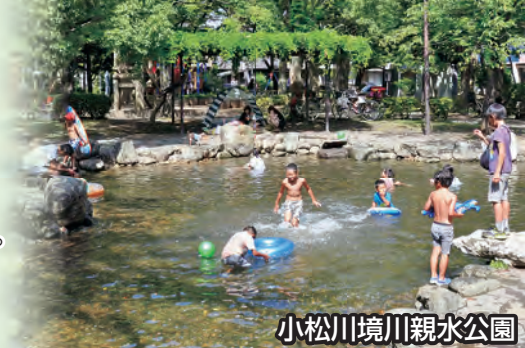
小松川境川親水公園

区内では、親水公園をはじめ、じゃぶじゃぶ池や噴水・滝など、合わせて22カ所で水遊びが楽しめます。 ※じゃぶじゃぶ池の開設期間は8月31日困まで。