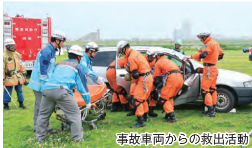
事故車両からの救出活動

▶情報収集伝達訓練/倒壊家屋からの救出訓練/医療救護訓練/市川市との物資輸送訓練/大規模消火活動/炊き出し訓練 ほか