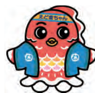
江戸っ子金魚「えど金ちゃん」

販売会 通常販売のほかに、年に一度の金魚の特売市です。お気に入りの金魚を見つけませんか。販売会の日程は未定です。