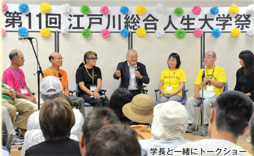
学長と一緒にトークショー

ステージ 学生が繰り広げる楽しいステージです。北野学長や各学科長が出演するコーナーもあります