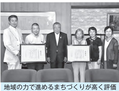
地域の力で進めるまちづくりが高く評価

江戸川区役所本庁舎前庭で、年間を通して花壇の育成管理を行っており、緑化推進の啓発に貢献しています。