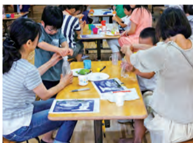
◎このほか、異常気象に関するパネル・書籍の展示などを行います。