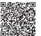
▲区ホームページ指定歯科医療機関一覧QRコード