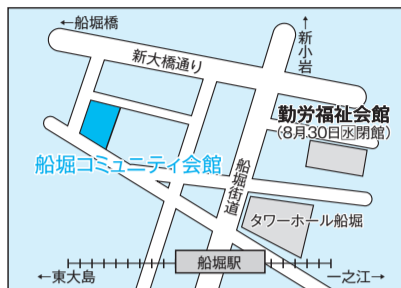
交通 都営新宿線「船堀駅」から徒歩5分

9月2日(土)にオープン予定の船堀コミュニティ会館(船堀1-3-1)は、集会室や和室などを備えたコミュニティ施設です。ぜひご利用ください。