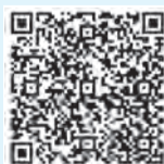
▲区ホームページ助成金情報QRコード