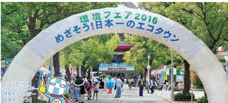
江戸川区 クリーンエネルギー 啓発キャラクター 「スイソマン」

近年多発している集中豪雨などの異常気象は、地球温暖化が原因の一つといわれています。環境フェア2017では、地球温暖化を引き起こす温室効果ガスを減らすことをメインテーマに、さまざまな取り組みを紹介します。あなたも身近にできるエコな活動を始めてみませんか。