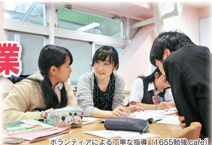
ボランティアによる丁寧な指導 (1655勉強cafe)

区では、子どもの健やかな成長を願い、学習習慣の定着や学ぶ意欲の向上などを図る「学習支援事業」をさまざまな施設で実施しています。次代を担う子どもたちが、家庭環境に左右されることなく、誰もが夢に近づく機会を得られるよう支援を推進していきます。