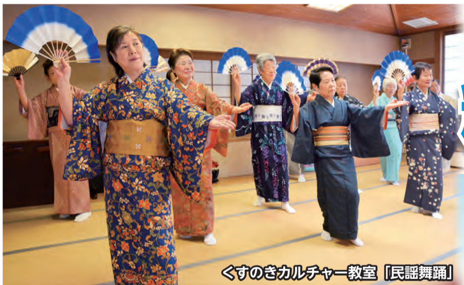
くすのきカルチャー教室 [民謡舞踊]