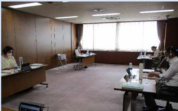
区役所(密集を防ぐため離れて着席)