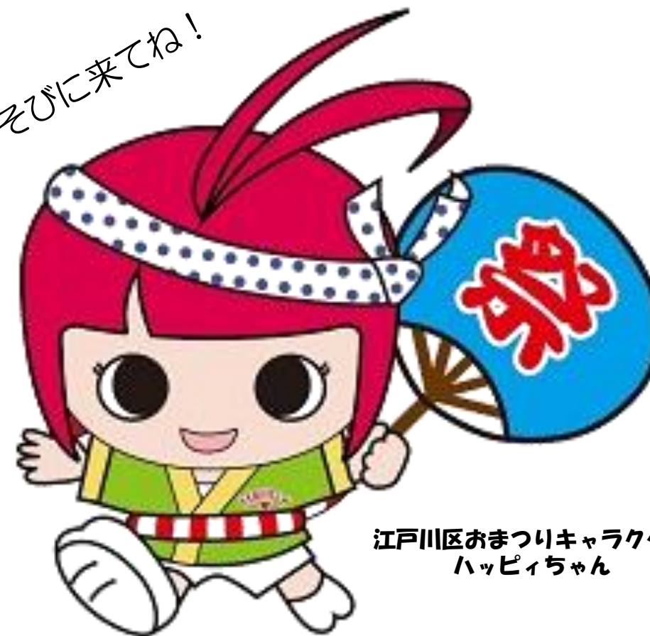
江戸川区おまつりキャラクター ハッピーちゃん