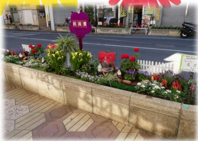
第49回花壇コンクール区長賞花壇