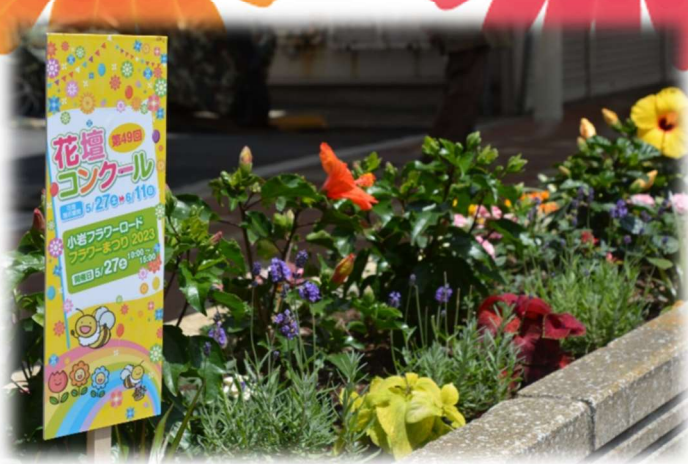
第49回植付け後の花壇の様子

小岩フラワーロードの花壇を舞台に、ご自身で花を選び、デザインした花壇づくりをしてみませんか。大人から子供まで、初心者の方も大歓迎です！今回は第50回記念のコンクールなので、みんなで小岩フラワーロードを彩りましょう！ 花壇に植え付ける花苗は事務局でご用意します。