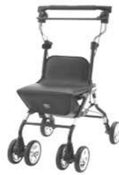
ライトステップ・タイニ

申請できる方 条件すべてに当てはまる方が対象です 江戸川区内に在住 65歳以上 住民税が非課税 日常生活でシルバーカーを必要とする状況 要介護4・5の認定を受けていない 介護老人保健施設、特別養護老人ホームに入所していない ひとりで安全にシルバーカーを操作できる 申請窓口配置の見本品をひとりで安全に操作できるかの確認が必要です